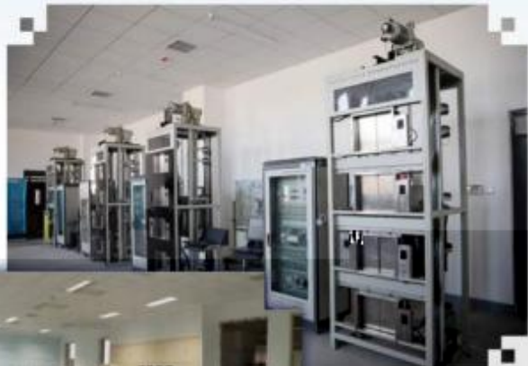
智能电梯安装调试 维护训练场所